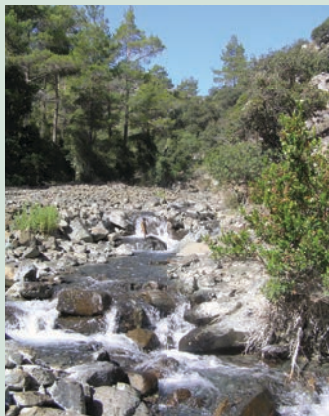
Μονοπάτι Λούματα των Αετών

Η πορεία διασχίζει μια πανέμορφη πλαγιά με πυκνό δάσος, καταλήγοντας στον ποταμό Λούματα των Αετών ο οποίος έχει σημαντική ροή, ακόμη και το καλοκαίρι. Από εκεί, ακολουθεί πορεία κατά μήκος της κοίτης του ποταμού και τελειώνει σε δρόμο του χωριού, κοντά στο κοινοτικό πάρκο Αμιάντου . Το μεγαλύτερο κομμάτι του μονοπατιού αποτελεί μέρος παλαιότερης διαδρομής που χρησιμοποιούσαν οι εργάτες του μεταλλείου Αμιάντου . Η πορεία είναι γραμμική, αλλά, μπορεί να γίνει και κυκλική, ακολουθώντας δρόμο μέσα στην κοινότητα προς την κατασκήνωση της ΣΕΚ. Το μονοπάτι αποτελεί τμήμα του Εθνικού Δασικού Πάρκου Τροόδους που είναι περιοχή NATURA 2000.