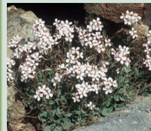
Arabis purpurea - Κλάματα της Παναγίας