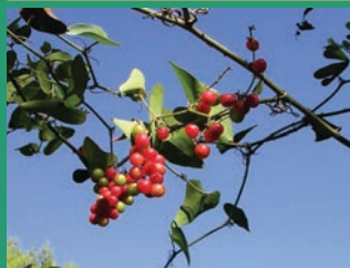
Smilax aspera -Αντζουλόβατος