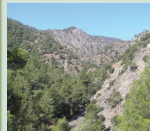
Pinus brutia -Τραχεία Πεύκη

Η αφετηρία του μονοπατιού βρίσκεται σε σημείο πάνω στον δρόμο Αμίαντου - Κατασκήνωσης ΣΕΚ . Ερχόμενοι από τον δρόμο Καρβουνά προς Σαϊτά η διαδρομή περνά μέσα από την κοινότητα Αμίαντος . Μετά το γεφύρι στρίψετε δεξιά για τις κατασκήνωσεις ΣΕΚ. Στον δρόμο αυτό θα βρείτε την αφετηρία και το χαρακτηριστικό κίосκι με πληροφορίες. Σήμανση για το μονοπάτι θα συναντήσετε στον κύριο δρόμο Καρβουνά - Αμίαντου και στον δευτερεύοντα δρόμο μέσα στο χωριό. Μπορείτε να πάτε εκεί με το ιδιωτικό σας όχημα σταθμευόντάς το στον χώρο στην αφετηρία. Τις καθημερινές μπορείτε, επίσης, να χρησιμοποιήσετε τα λεωφορεία της ΕΜΕΛ από και προς τη Λεμεσό (δρομολόγιο 64). Σχετικές λεπτομέρειες είναι διαθέσιμες στον σύνδεσμο http://www.limassolbuses.com/rural-routes . Από και προς τη Λευκωσία μπορείτε να χρησιμοποιήσετε τα δρομολόγια της ΟΣΕΛ (δρομολόγιο ΒΔ39). Σχετικές λεπτομέρειες υπάρχουν στον σύνδεσμο http://www.osel.com.cy .