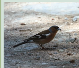
Fringilla coelebs -Σπίνος