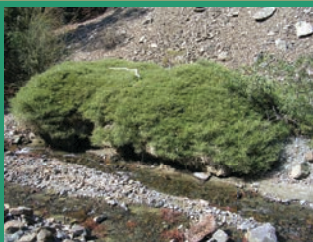
Genista fasselata var. crudelis - Ρασιήν του Τροόδους